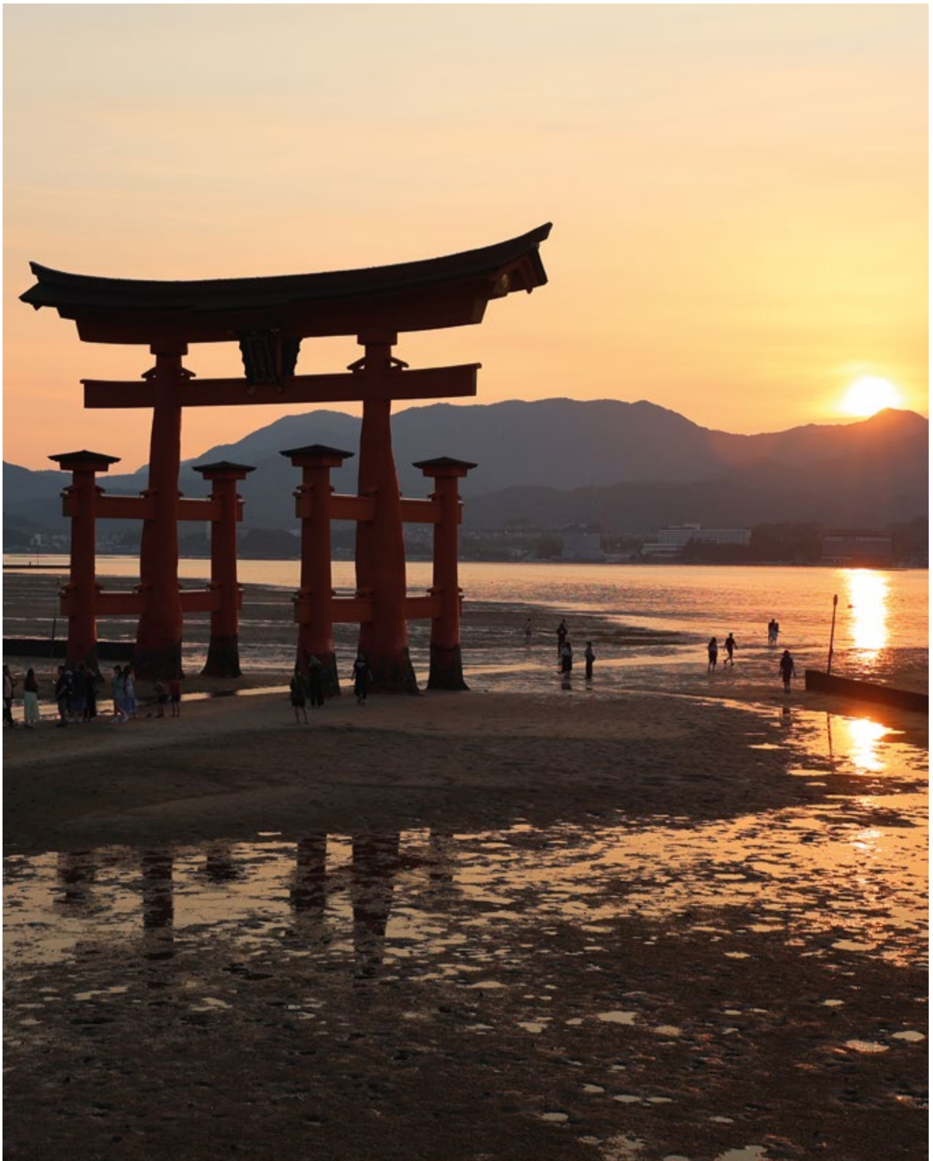
Miyajima, santuario Itsukushima.