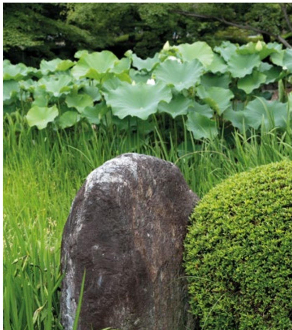
Foto: Kyoto, tempio To-ji.

Di questo calendario sono state realizzate 30 copie numerate.