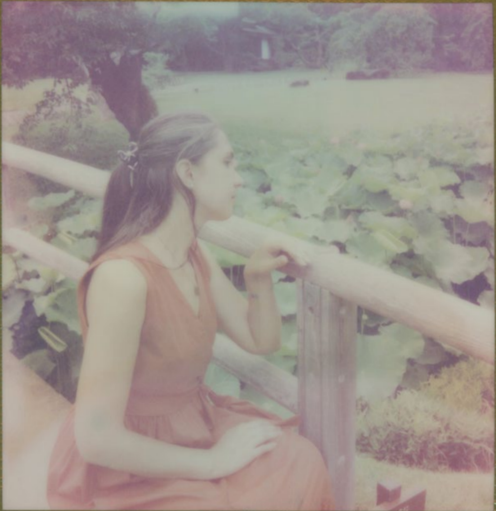
Tokyo, giardini Koishikawa Kōraku-en.