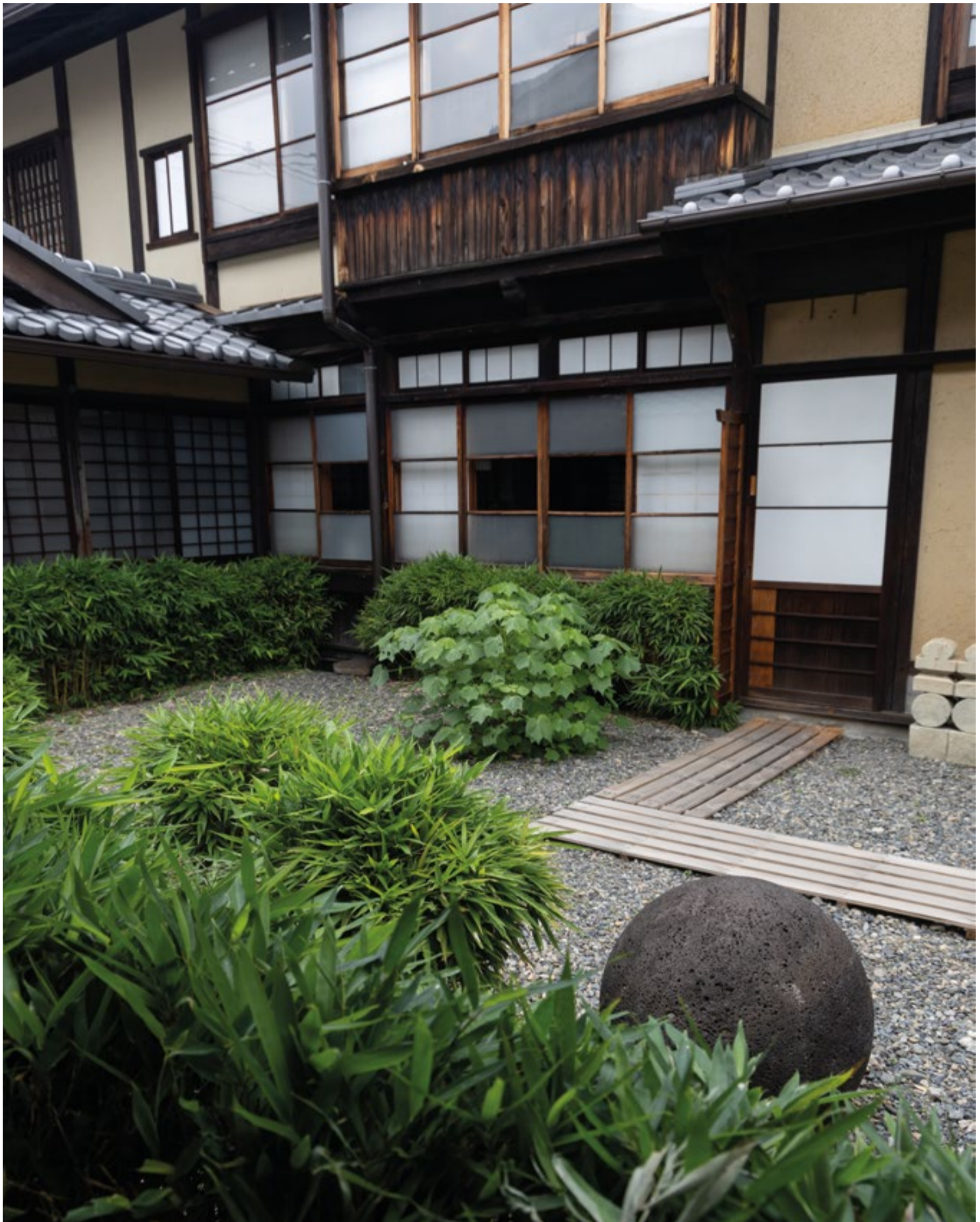
Kyoto, casa museo di Kawai Kanjiro.