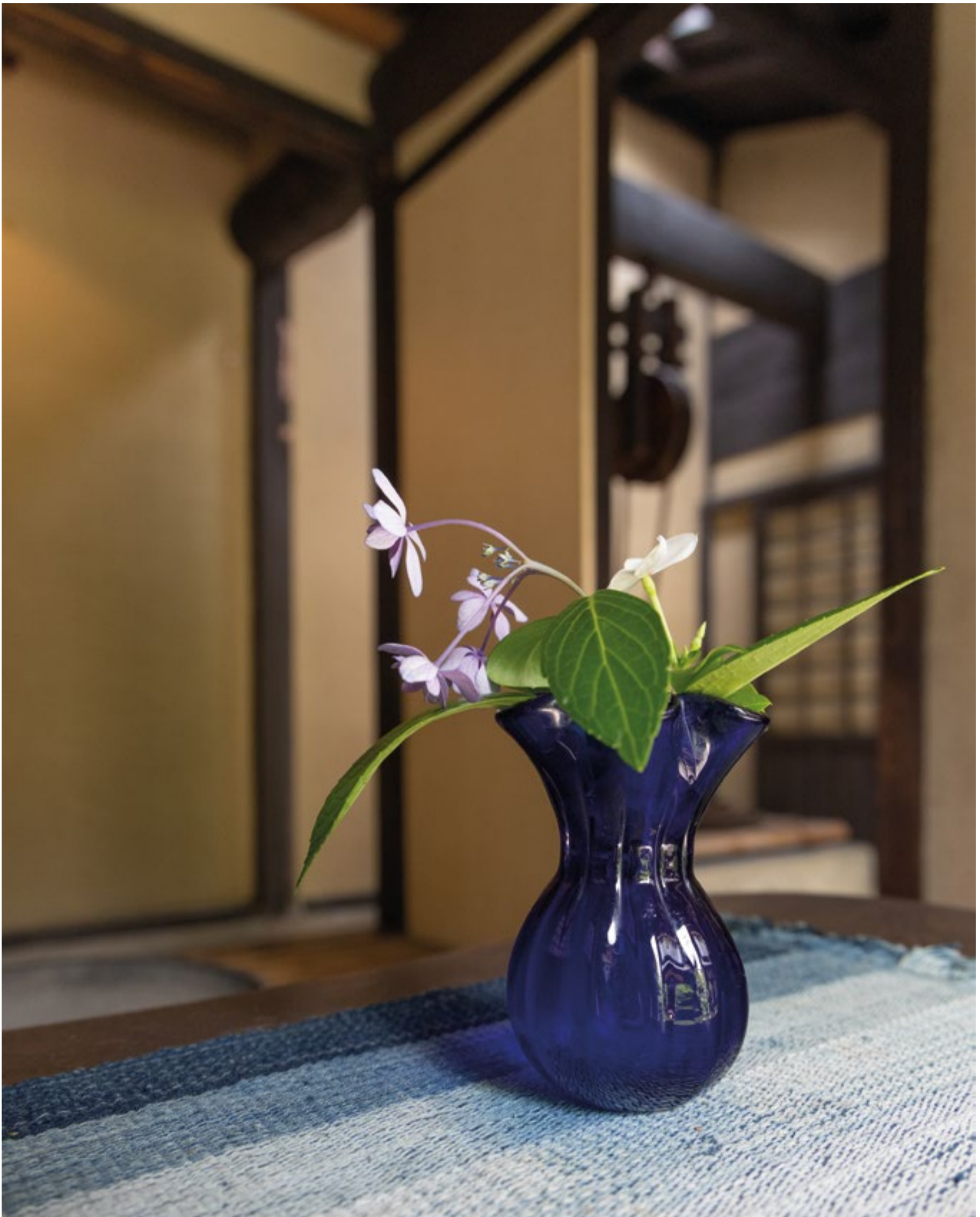
Kyoto, casa museo di Kawai Kanjiro.