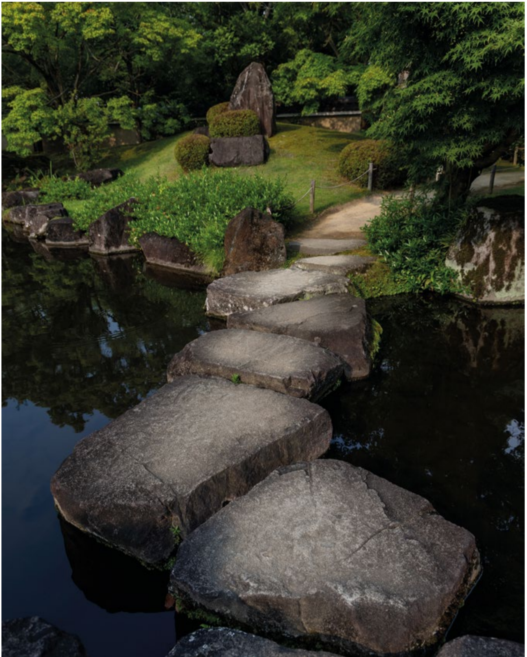
Himeji, giardini Koko-en.